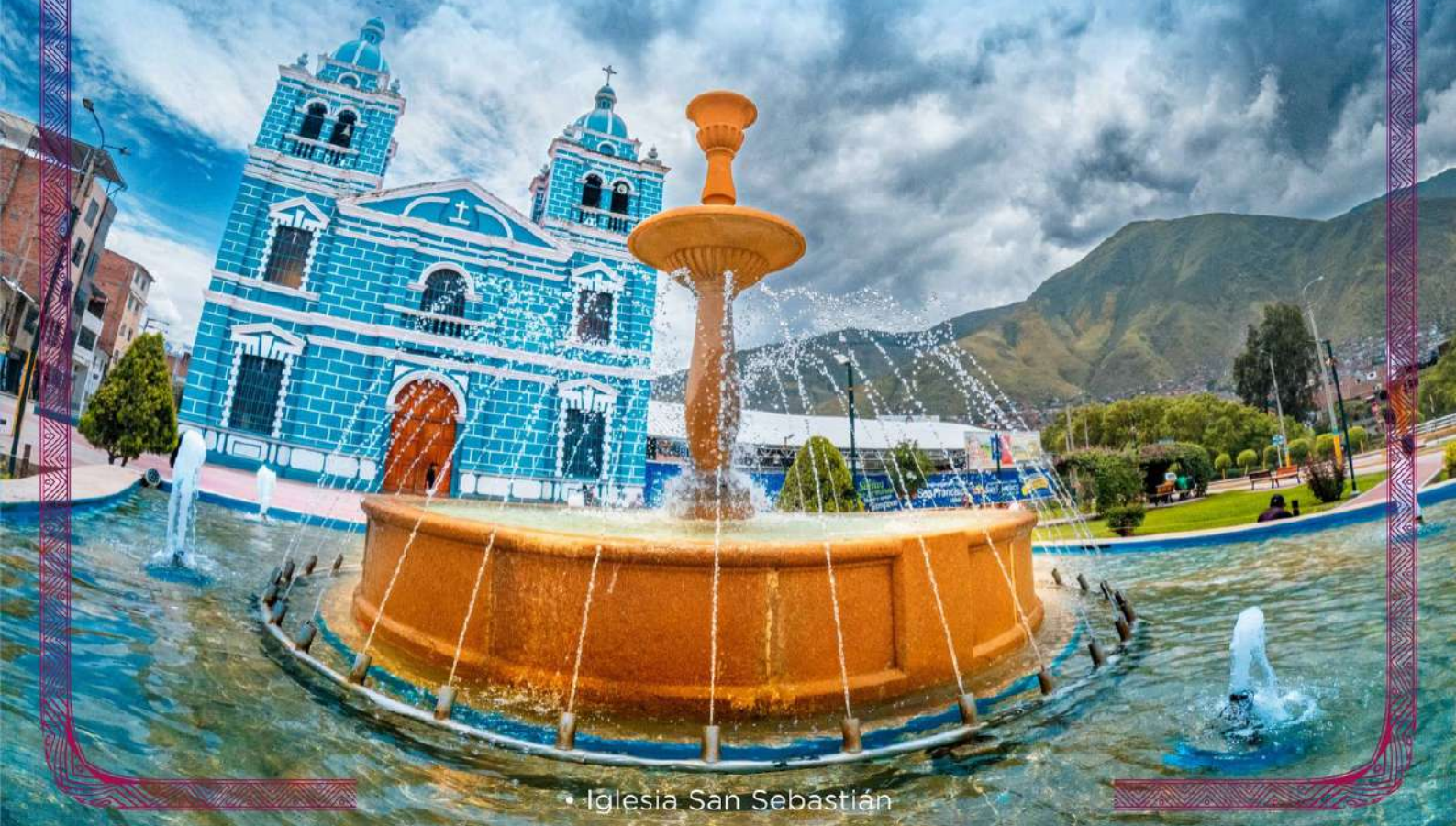
• Iglesia San Sebastián