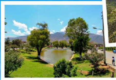
• Laguna Viña del Río