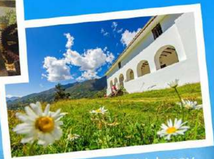
• Casa Hacienda Shishmay