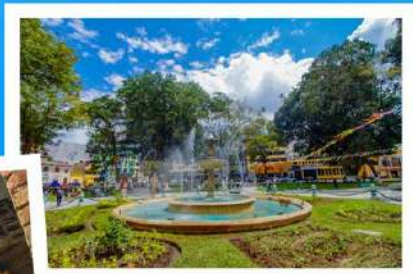
• Pileta Plaza de Armas