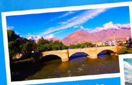
• Puente Calicanto